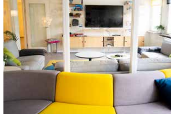
Ljusa, trivsamma lokaler.

Möjlighet finns för en förtydligande vardag med schemastruktur och bildstöd.