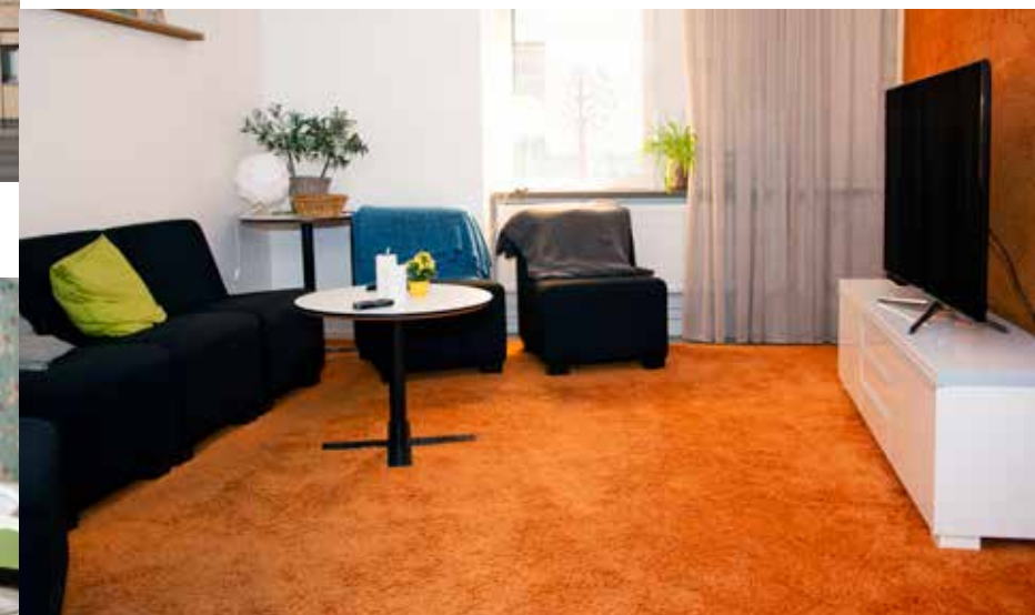
Här hänger vi gärna!

Vi måste möta varje ung människa med förståelse och acceptans för denne som person.