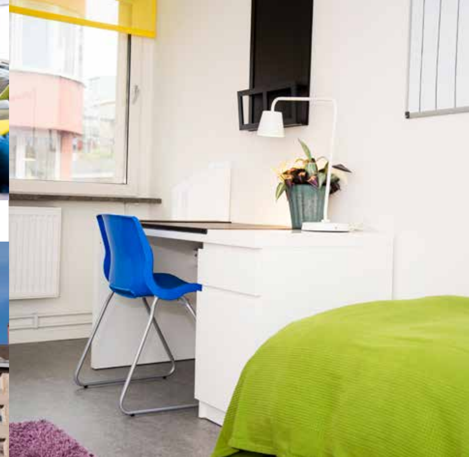
Eget rum, såklart.