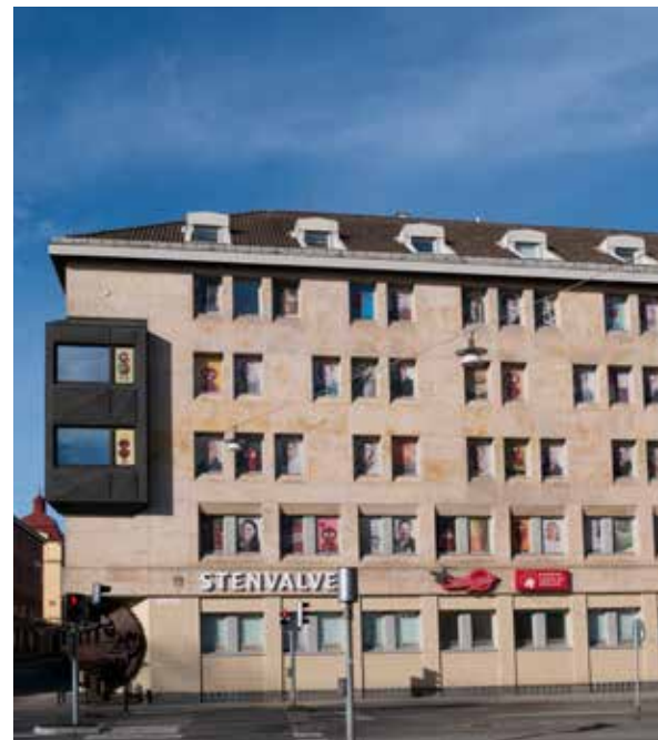
Mitt i centrala Jönköping - nära till allt.